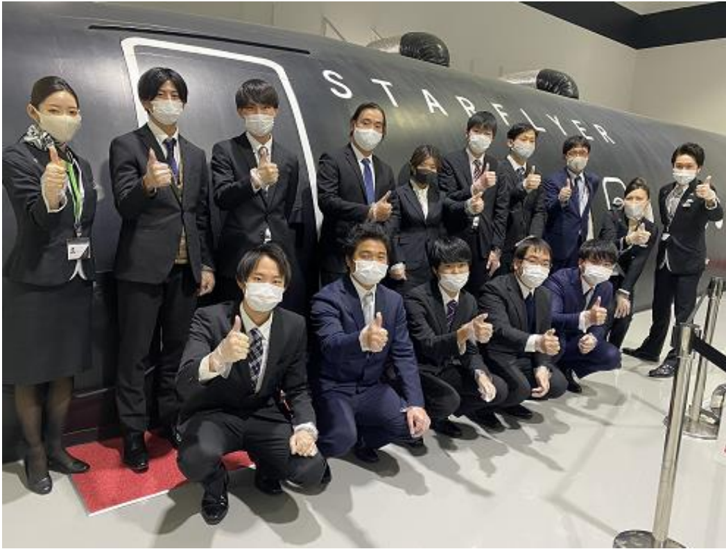
参加者全員による記念撮影 充実感でいっぱいです。