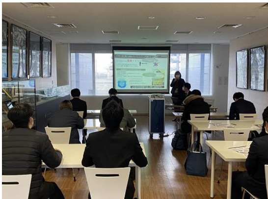
グランドハンドリングに関する総括の講義

トへの無線による気象情報の提供等、お客様を安全に目的地へお届けするため機長と協力しながら航空機を飛ばす業務であることについて講義頂き、参加した学生も興味深く聞き入っていました。