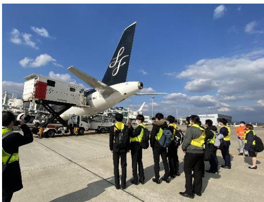
普段こんな光景を目にすることはできません！