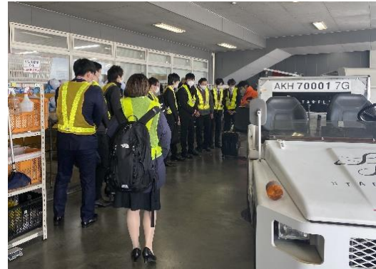
お客様から預かった手荷物を機内へ運びます