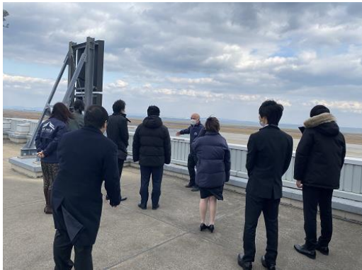
滑走路延伸についてお話をうかがいました