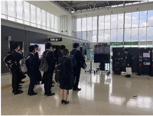
北九州空港到着！研修スケジュール等の確認