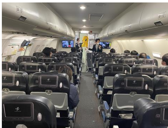
モックアップ施設での研修の様子

その他、緊急脱出の際に使用するスライドの見学を行い、安全に関する危機管理についても学ぶことが出来ました。