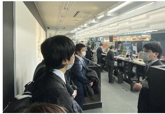
チェックインカウンター内の様子

お昼休みには、北九州エアターミナル株式会社様のご配慮で、送迎デッキの更に奥から、現在予定されている滑走路延伸計画についてご説明を頂きました。