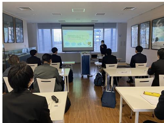
ディスパッチャー業務に関する講義

次に、客室乗務員が実際に訓練を行うモックアップ（航空機の模型）に入り、現役キャビンアテンダント 2 名の方による接客サービスについて模範動作を学んだ後、参加した学生も飲み物を提供サービスの体験を行いました。学生は本物と同じ設備を使用し、揺れる機内で飲み物を提供するサービスの大変さ、その他、飛行中の安全危機管理の重要性、非常時の救助員としての責任の大きさを実感していました。