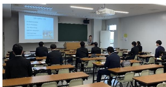
グランドスタッフ業務について学ぶ様子

3日目は、株式会社スターフライヤーの本社がある北九州空港へ出向き、10時よりチェックインカウンターのバックヤード見学、カウンターで預けた手荷物が航空機へ搭載されるまでの流れについて見学し、コンテナへの荷物仕分け、そのコンテナを機内の荷物室へ運ぶまでの車両の動きを見学しました。また、到着した航空機をエプロンと呼ばれる駐機場まで誘導するランプハンドリング業務の見学、航空機が滑走路へ向かう際、航空機を誘導路へプッシュバックさせるためのトーイングトラクターへの体験乗車、航空機とターミナルビルを結ぶボーディングブリッジの体験操作など、西鉄エアサービス株式会社様のご協力により、研修をさせて頂きました。