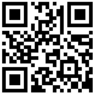
読み取り用 QR コード