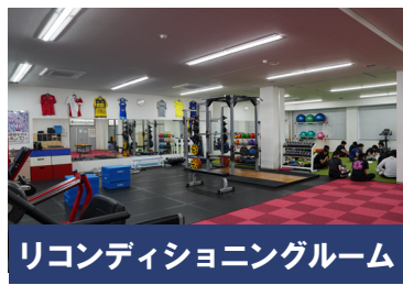
リコンディショニングルーム