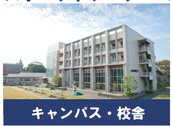
キャンパス・校舎